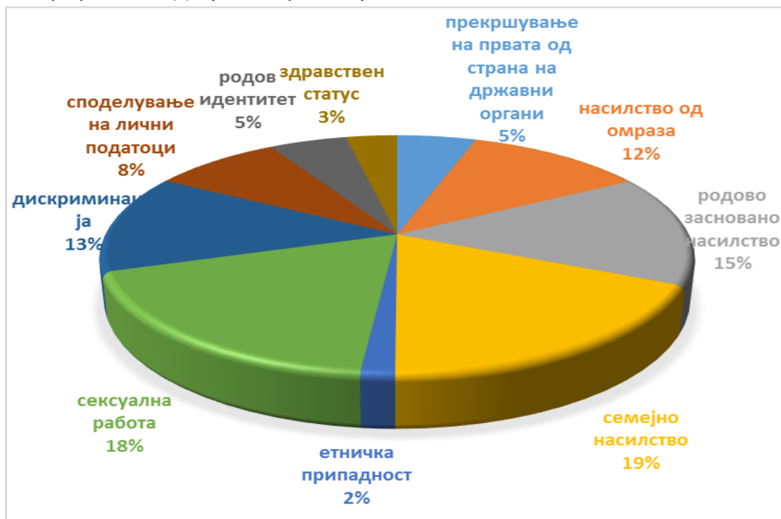
Графинкон 2: Документираните случаи по области

Најголем број од документираните случаи се во областа на сексуална работа , што укажува дека сексуалните работници трпат насилство и дискриминација најмногу поради изборот на работа. Најбруталните прекршувања, каде што е присутно и физичко и психичко насилство и сексуална злоупотреба, од еден или повеќе сторители, се токму поради изборот на работа. Исто така, се издвојува прекршувањето на правата од страна на државни органи токму поради сексуалната работа. Во сите 3 случаи каде како сторител на прекршувањето на правото се јавува државен орган, како основ за истиот се смета сексуалната работа. Ова покажува дека државата ги третира сексуалните работници како криминалци, што особено е карактеристично за службите на Министерството за внатрешни работи (3 документираните случаи) и ги потврдува стереотипите и верувањата дека сексуалните работници се неморални и се прекршители на законите. Оваа појава исто така придонесува да сексуалните работници при пријавување на насилството до надлежните органи најчесто не го кажуваат основот зошто е извршено насилството и го